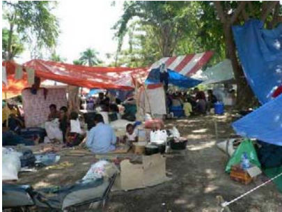
Flüchtlinge auf dem Flughafengelände im Mai 2006

2006 mit ihm ein Gespräch zur problematischen aktuellen politischen Lage und wie diese von der Zivilgesellschaft aus angegangen werden könnte.