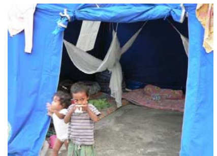
Flüchtlinge auf Gelände der Cannonian Sisters im Mai 2006

Um dies zu vermeiden, müssen die Verfassung und die demokratischen Spielregeln respektiert werden und sich Politiker und die politischen Parteien angesichts der allgemeinen Vertrauens- und Legitimationskrise rehabilitieren. Gerade auch, weil die heutige Krise viele Menschen an die Krise von 1975 erinnert und die Wahrnehmung bei ihnen nährt, dass die politischen Parteien den Konflikt geschaffen haben - statt sie als Werkzeug der Demokratie zu verstehen. Wir haben nicht aus der Vergangenheit gelernt, wir sind nur an uns selbst interessiert und nicht daran, wie wir dem Land dienen können, daher brauchen wir einen Moment des nationalen Einhaltens, Reflektierens – „wir müssen uns hinsetzen und darüber sprechen, wie wir unser Problem lösen können“, regt José Guterres dringend an.