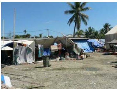
Flüchtlinge auf dem UN-Compound am 29.05.2006