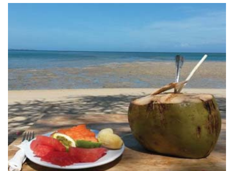
Tourismuspotenzial: Areia Branca in Dili

Damit wurde auch ein zentraler Widerspruch in der timoresischen Tourismuspolitik nicht aufgelöst. Denn während der Sektor laut der im Entwicklungsplan formulierten Vision einerseits als Jobmotor für die Jugend dienen und bis 2030 zum Wirtschaftszweig Nummer zwei hinter der Öl- und Gasindustrie ausgebaut werden soll, werden andererseits lediglich kleinere und lokal begrenzte touristische Entwicklungen gefördert, die dieses ambitionierte Ziel unerreichbar erscheinen lassen.