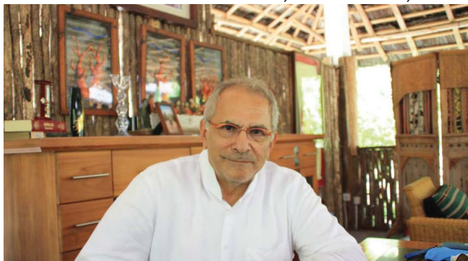
José Ramos-Horta speaks about peace and stability

racy and rule of law. Ours is an imperfect democracy with the many flaws common to democracies in Asia, Africa, Latin America and in parts of the West.