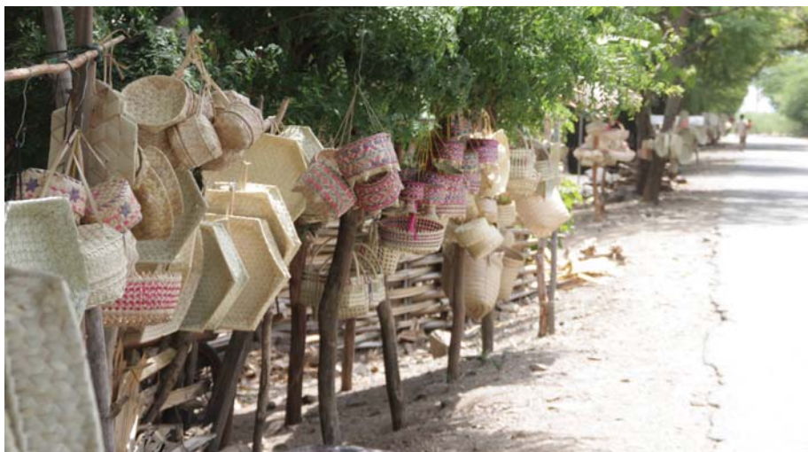
Hunderte von selbstgemachten Körben hängen am Straßenrand zum Verkauf, doch Touristen sieht man selten

zu entwickeln, die dann im Verbund beworben und vermarktet werden sollen. Wenn es funktioniert – leider beweisen viele CBT-Initiativen das Gegenteil, sobald die Unterstützung durch die Förderorganisationen wegbreicht – profitiert lediglich ein sehr kleiner Kreis von Menschen.