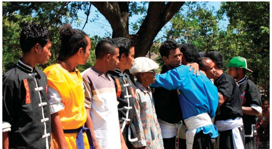
Martial Arts Gruppenmitglieder im Friedensprozess

aber auf der anderen Seite gibt es keinen guten Ansatz, mit möglichen Konflikten umzugehen, wie zum Beispiel, wenn Leute dafür von ihrem Land vertrieben werden. Für das Projekt in Suai hat die Regierung Land genommen. Sie zahlten einiges Geld, aber die Gemeinden sind nicht gut informiert worden. Ihnen wurden Kompensationen gezahlt, doch einige Familien haben mehr Geld bekommen als andere, das hat