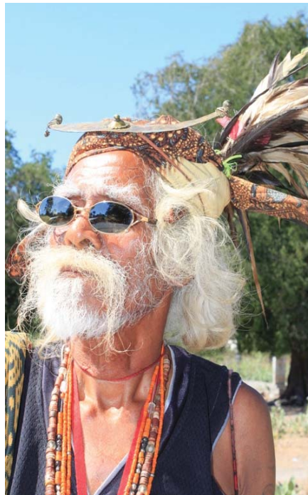
Ein Lia-Na'in, der „Hüter der Worte“

Staat zu den Bürgern zu bringen. Wir haben immer argumentiert, dass es ohne eine genuine Aufarbeitung der Vergangenheit keinen nachhaltigen Frieden geben kann. Es gibt jedoch auch Staaten, die sich gegen Aufarbeitungsprozesse stellen und in denen eine friedliche Entwicklung stattfindet. Und auch Sie sagen, nicht zurück zuschauen kann auch ein Beitrag zu einer friedlichen Zukunft sein.