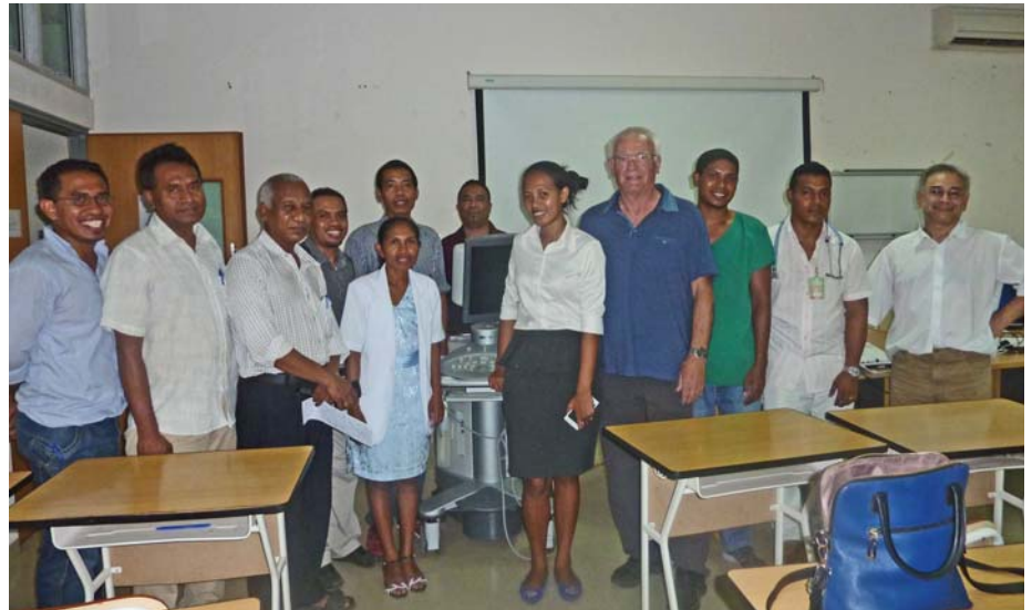
Stolze und erfolgreiche Kursteilnehmerinnen und Kursteilnehmer

lungen durchgeführt werden können. Sponsoren für diese Medikamente werden noch gesucht. Falls dieses Projekt erfolgreich ist, dürfte es die erste adjuvante Behandlung von Brustkrebs in Timor-Leste darstellen. 4. Weitere Maßnahmen