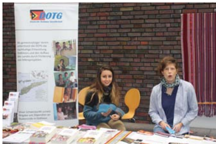
Der gemeinsame Stand der Stiftung Asienhaus und der DOTG auf dem „Inseltag“

Das abwechslungsreiche Programm lockte zahlreiche Besucher an, die gerne am Stand verweilten und sich kundig machten.