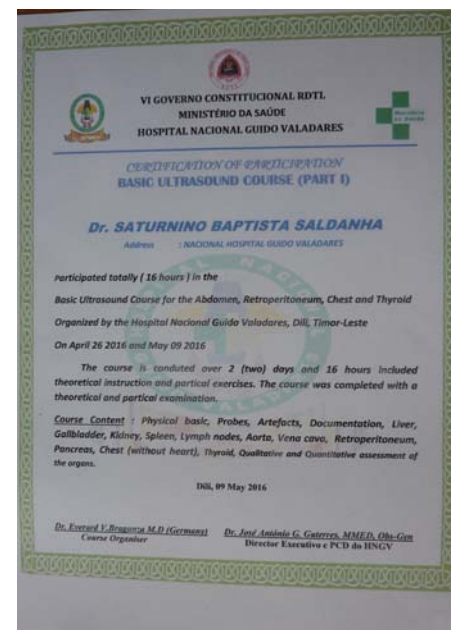
Urkunde für die erfolgreiche Teilnahme am Ultraschall-Grundkurs

Wir sind zuversichtlich, dass die Verbreitung von Sonographie nach deutschem Standard zu einer Verbesserung der diagnostischen Möglichkeiten und Minderung des Rufs nach teureren Untersuchungen wie z.B. CT führen wird, und planen weitere Grund- und anschließende Spezialistenkurse für 2017.