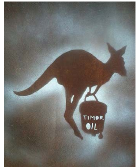
„Australia steals Timor Oil“

die Verantwortung trug. Downer nahm nämlich nach seinem Ausscheiden aus dem Parlament eine bezahlte Beratertätigkeit bei