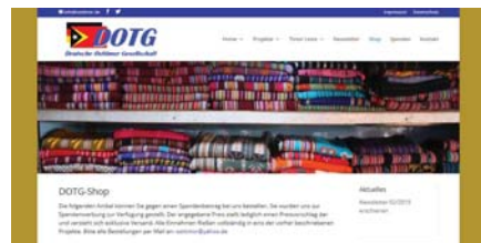
Die Neue Homepage der DOTG