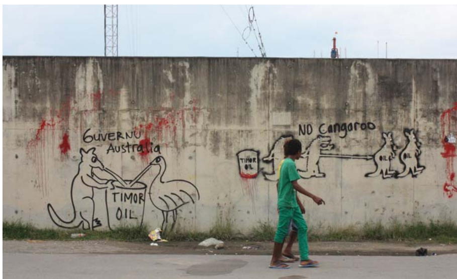
Graffiti an der Mauer der Botschaft Australiens

Am 3. März 2014 ordnete der Internationale Gerichtshof (ICJ) Australien an, die Spionage ge-