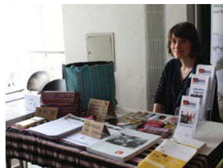
Der Stand der DOTG auf dem 4. Asientag

Zwangsarbeit in Südostasien und „Hunger“ nach Ressourcen. Auf dem „Markt der Möglichkeiten“ bestand die Möglichkeit, sich über die Arbeit diverser Nichtregierungsorganisationen, so auch der DOTG, zu informieren.