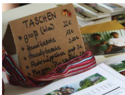
Wie immer gab es schöne Artikel aus dem DOTG-Shop zu erwerben

Auch dieses Jahr zeigte die DOTG am 16.04 in der Alten Feuerwache im Kölner Agnesviertel wieder ihre Präsenz durch einen Infostand. Dort konnte man nicht nur über Timor-Leste ins Gespräch kommen, sondern auch handgemachte Seife und aus den traditionellen gewebten Tais genähte Taschen kaufen. Der Erlös des Verkaufs kommt komplett den Projekten der DOTG vor Ort zu Gute.